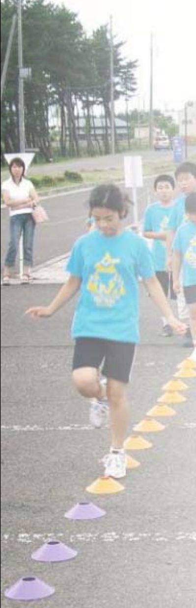
■2007JTUちびっこ・ジュニアトライアスロン教室 ポスター