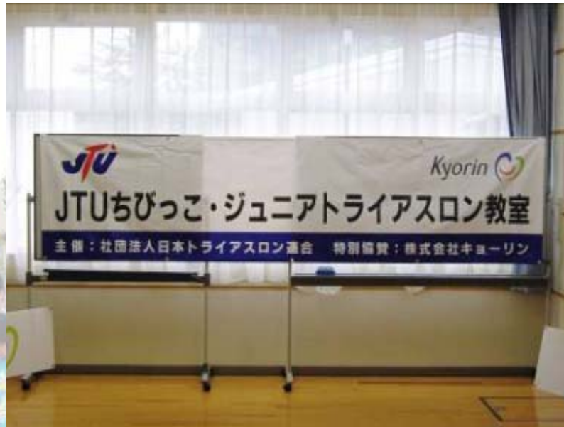
■横断幕(オリエンテーション会場設置)