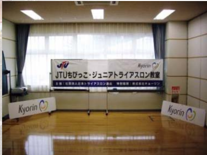
■横断幕とアドボード(オリエンテーション会場設置)