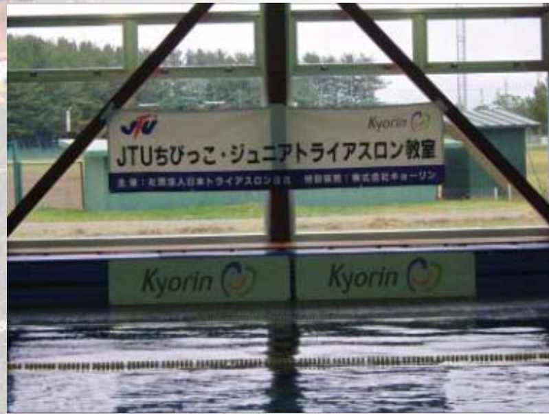
■横断幕とアドボード(プール会場設置)