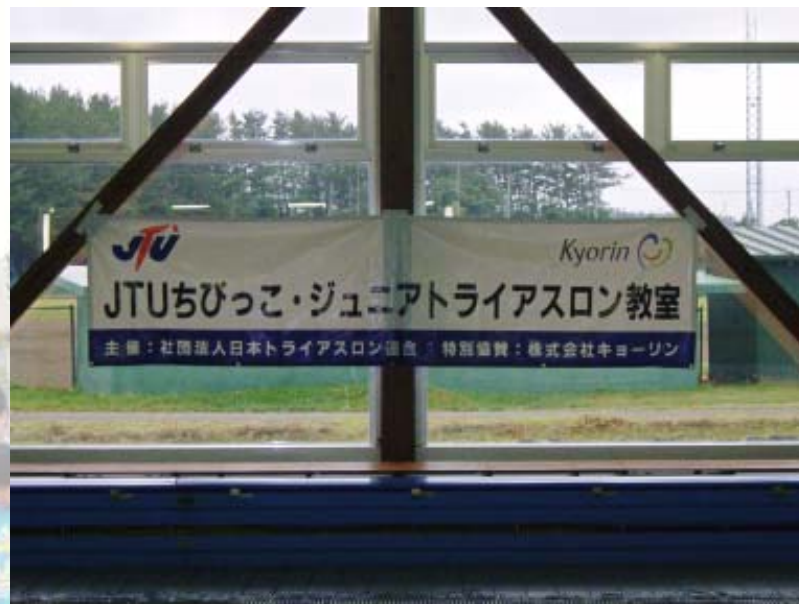
■横断幕(プール会場設置)