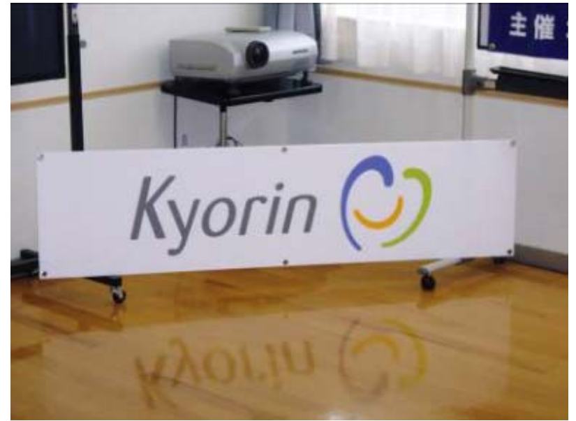
■アドボード(オリエンテーション会場設置)