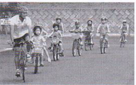
トライアスロンに挑戦する参加者たち (アリナスで)