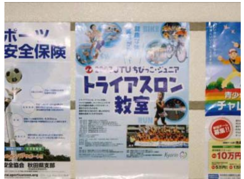
■ポスター(会場内掲出)