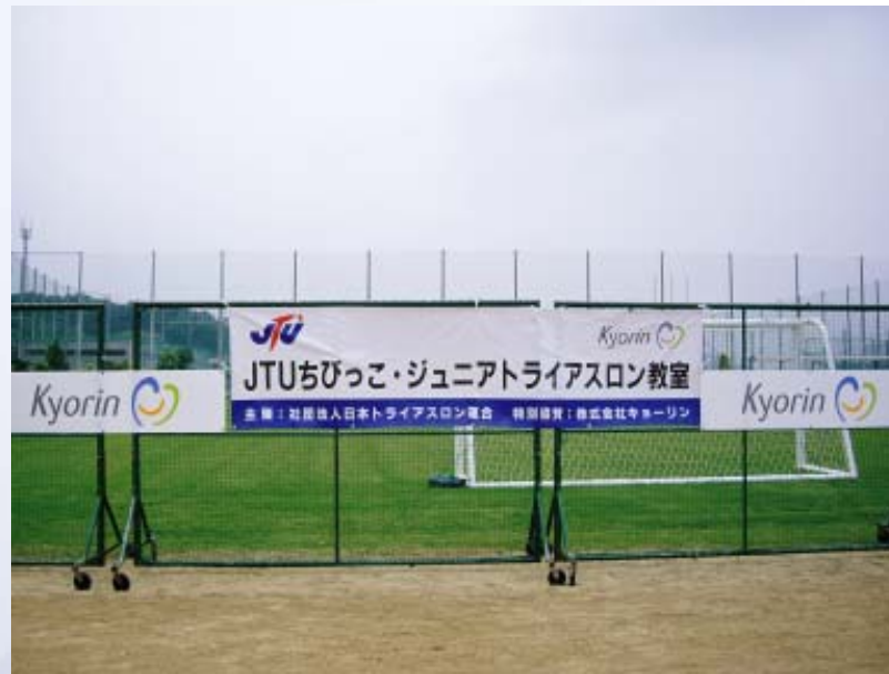
■横断幕とアドボード（屋外設置）