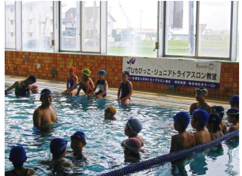
■横断幕（屋内・プール会場設置）