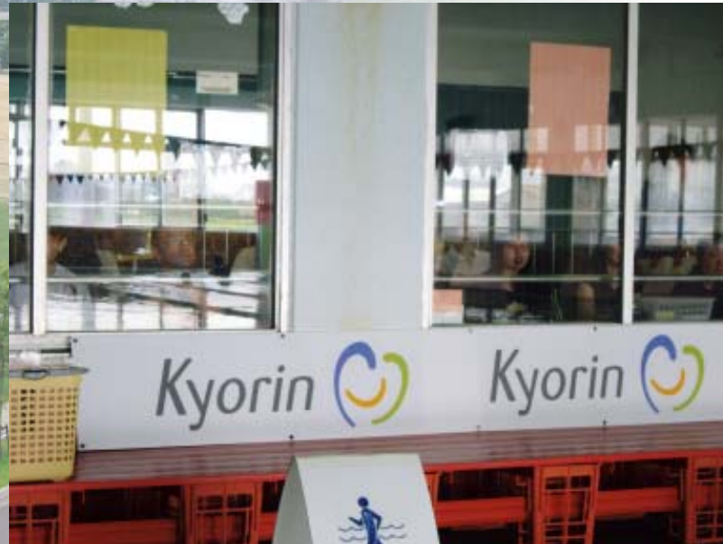
■アドボード 屋内設置