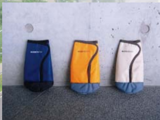
■記念品(ペットボトルクーラー)