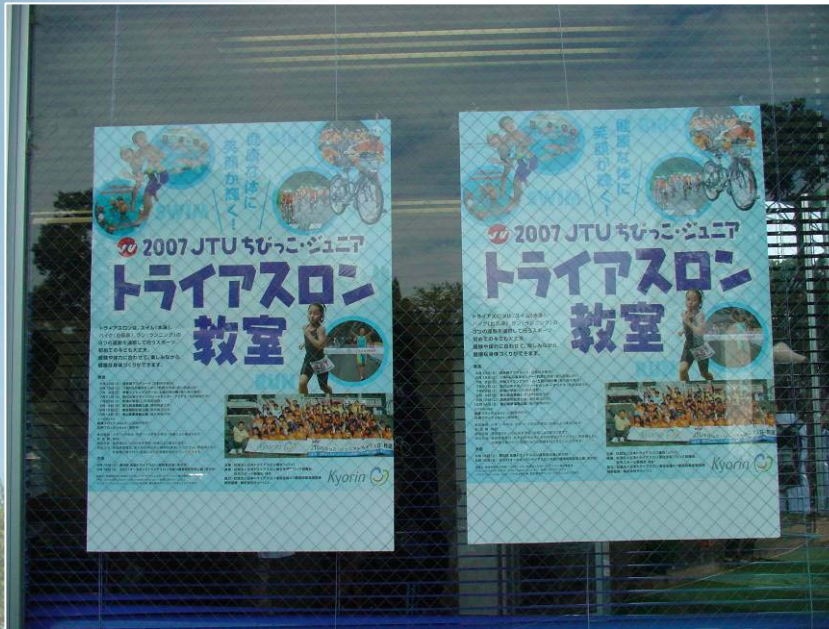
オールキッズ大会本部にも教室ポスターを貼付