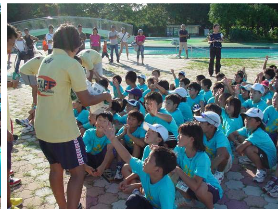
参加者全員に記念品が配布された