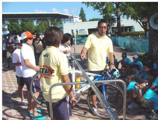
小学生高学年グループ。実際のバイクを使用し、設置の仕方やすタータイミグなど重要なポイントを説明。