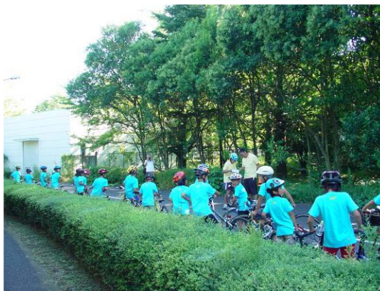
コーチを先頭に一列に並んで走行