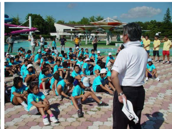
子どもたちへ激励の言葉をいただきました