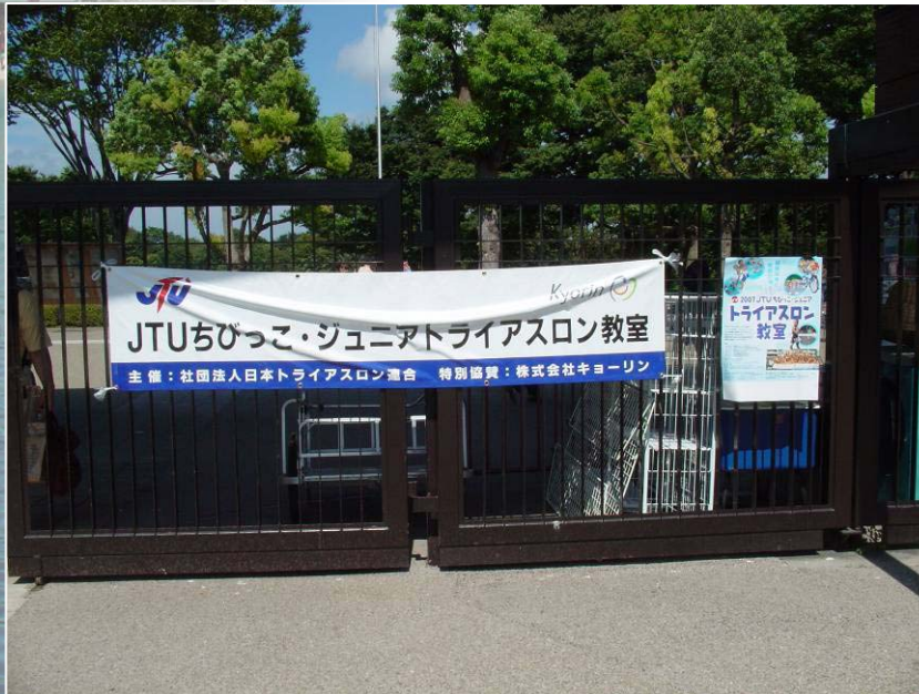
横断幕とポスター(西立川ロゲート入口)