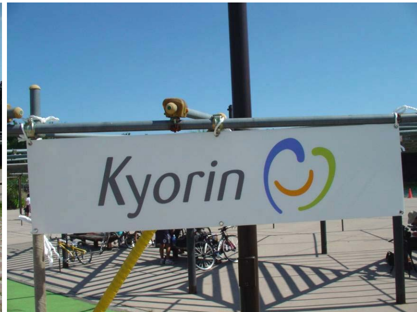
アドボード(公園内レインボープール広場)