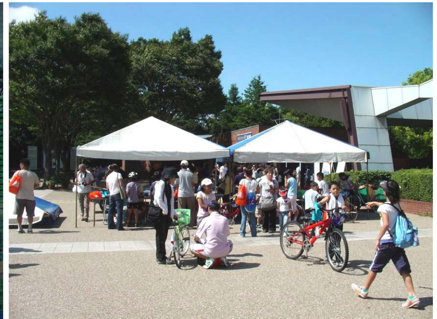
受付会場(西立川ゲート入口前に設置)