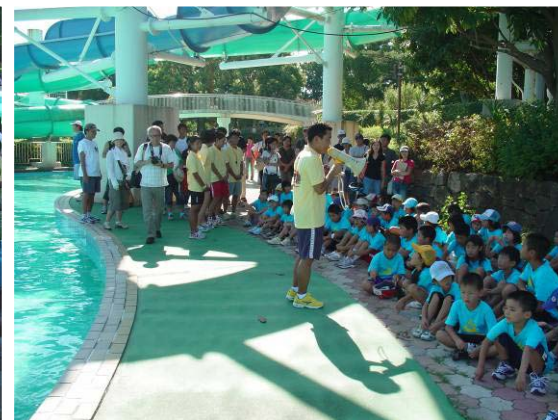
松山インストラクターは小学生低学年を担当。たくさんの保護者も一緒に参加。