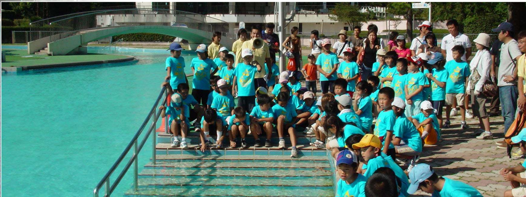
小学生低学年のグループ。スイムの終了地点の確認、給水ポイントの位置とスイム後の水分補給について説明を行った。