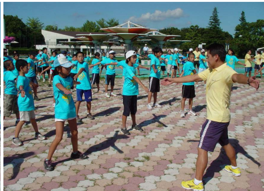
参加者全員で準備体操を実施