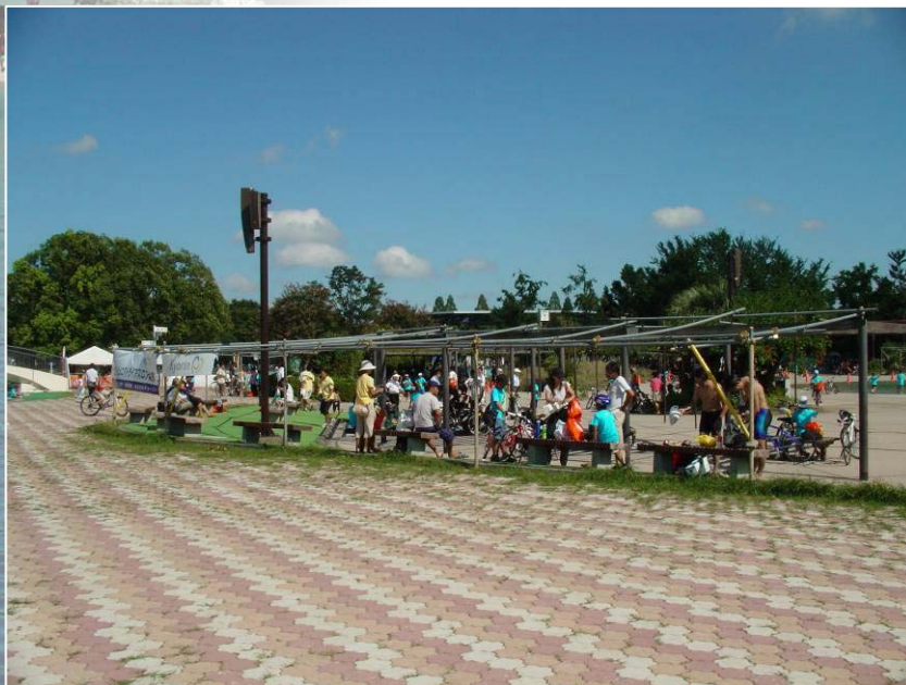
開催を待つ参加者と家族、当日は参加人数が多いため開催1時間30前から受付を行った