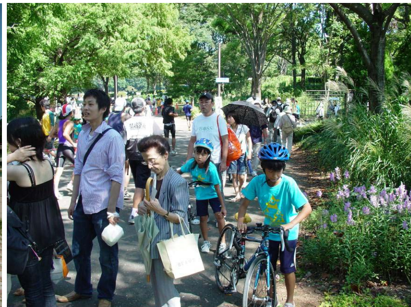
入口から会場へと移動する参加者、当日は全国高校生大会が午前開催された