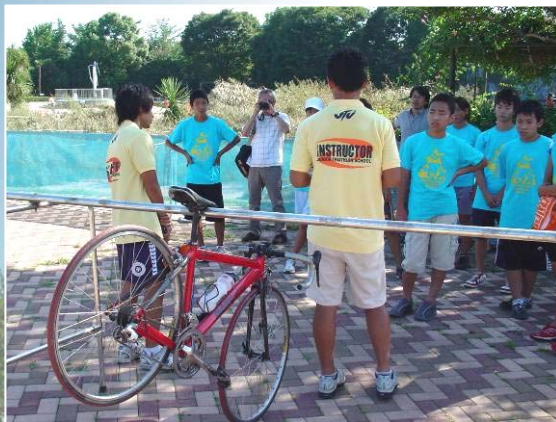
中学生グループはバイクのタイプに応じて個別にアドバイス。参加者にバイクの手入れを習慣づけて欲しいという話しも。

トランジションでのルールやヘルメットの重要性、かぶり方・とり方のタイミングなどをわかりやすく説明。 また、バイクのタイプ別に、バイクの置き方やテクニックなどの説明も行った。