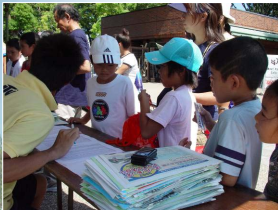
受付で学年と名前を伝える参加者

教室開催当日、東京は32°Cの猛暑日に。翌日のオールキッズ大会の事前受付とあわせ、多くの子ども達が会場を訪れた。 [教室参加人数] 小学生:131名 中学生:17名 合計:148名