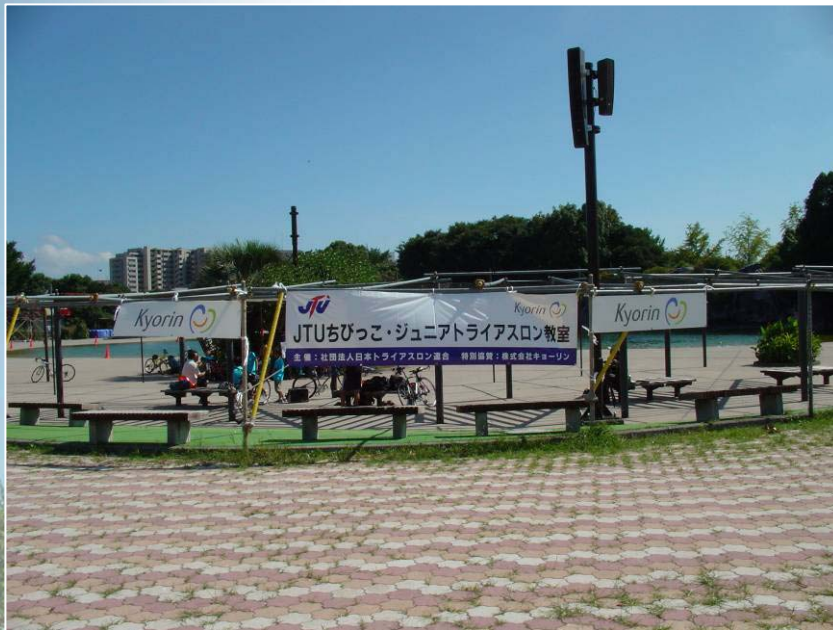
横断幕とアドボード(公園内レインボープール広場)