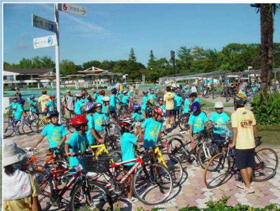
バイク走行の準備をする4年生

次にバイクコースを実際に走行。コーチがコース説明をしながら、周回数、分岐点の確認を行った。 保護者や選手が一番気になっていたのがバイクコースだったので、参加者にとってとても良い試走になった。