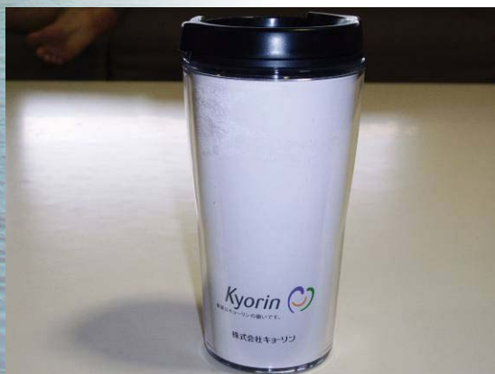
■記念品(ドリンクボトル)