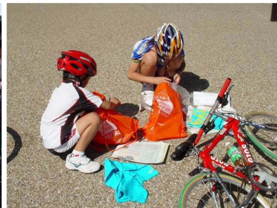
受付で受け取った配布物を確認