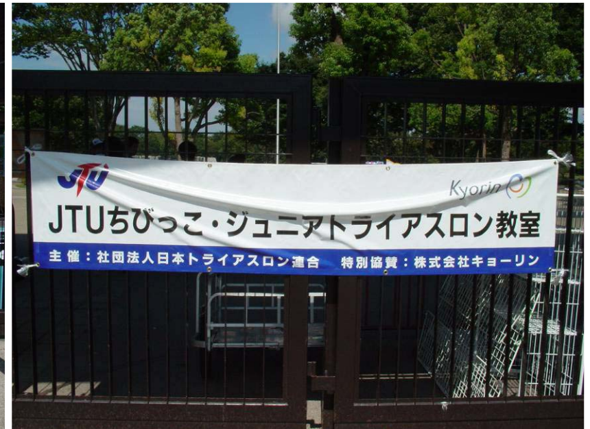
横断幕(西立川ロゲート入口)