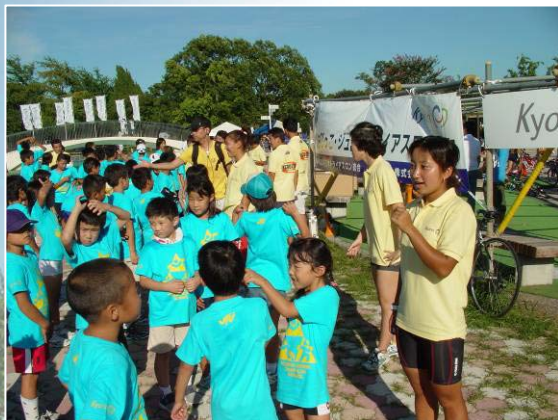
バイク試走を終えた後、広場に集合

閉会式では明日の大会の諸注意事項、熱中症対策について、インストラクターから話があった。 参加者全員で記念撮影をした後、株式会社キョーリン様から記念品のドリンクボトルが配布された。