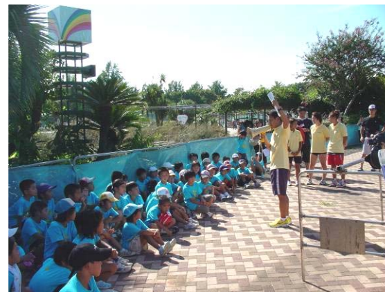
小学生低学年グループ。ヘルメットの重要性、かぶり方・ぬぎ方を説明。トランジションであせらないようにとアドバイス。