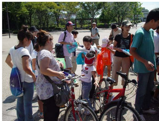
翌日の大会にあわせ、多くの参加者が来場