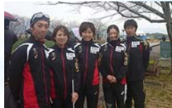
第5回ITUトライアスロン・パラトライアスロン・フォーラム, 2016年2月6, 7日