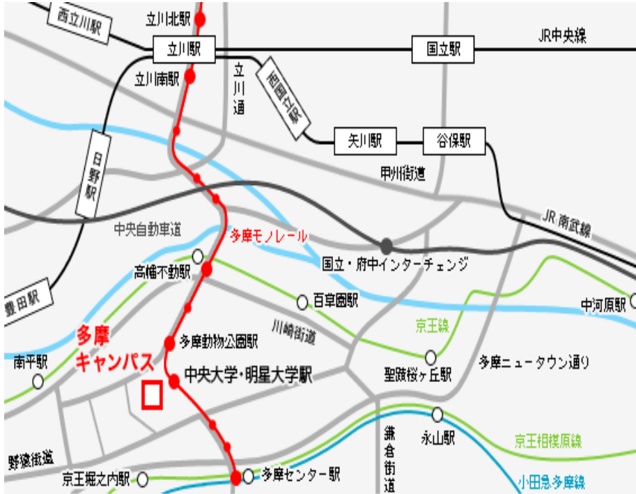
中央大学多摩キャンパス内 第2体育館室内プール (多摩モノレール「中央大学・明星大学駅」徒歩5分)