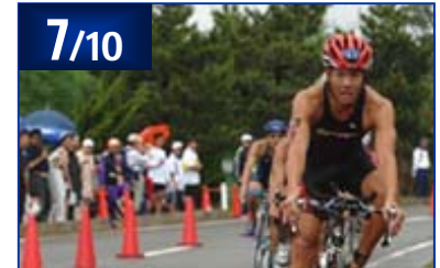
2005 ITU国際イベント七ヶ浜大会 / NTTトライアスロンジャパンカップ第4戦 / ASTCアジアカップ 七ヶ浜大会