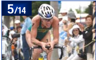
2005 ITUトライアスロンワールドカップ石垣島大会 / 2005 NTTトライアスロンジャパンカップ第1戦