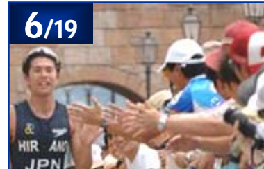
2005 ITU国際イベント和歌山大会 / NTTトライアスロンジャパンカップ第3戦