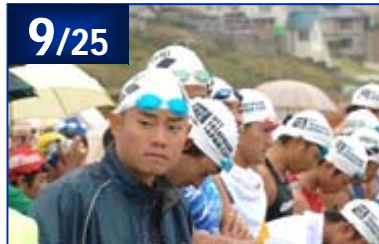
2005 ITU国際イベント村上大会 / NTTトライアスロンジャパンカップ第5戦