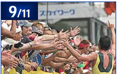
2005 ITUトライアスロン世界選手権(エリート・U23・ジュニア・アクアスロン)