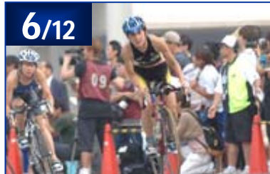
2005 ITU国際イベント幕張大会 / NTTトライアスロンジャパンカップ第2戦