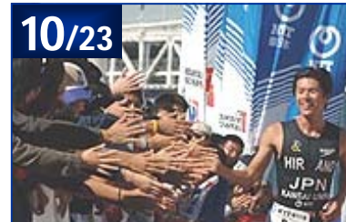
2005 ITU国際イベント東京港大会 / 第11回日本トライアスロン選手権東京港大会 / 2005ジャパンカップシリーズチャンピオンシップ大会 / NTTトライアスロンジャパンカップ第6戦